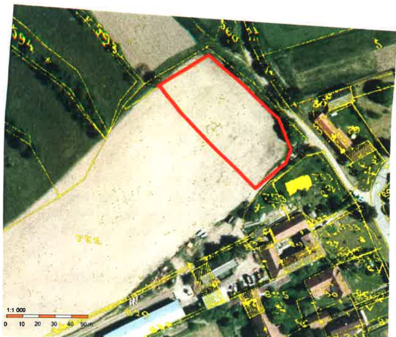
Obrázek 3: Výřez KN mapy na podkladu ortofotomapy s vyznačením požadavku p. Marvana (pozemek p.č. 752 v k.ú. Drahonín)